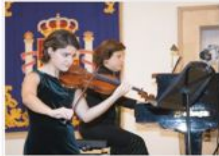
Juntas, madre e hija interpretaron en Palma de Mallorca un programa que incluyó obras de varios compositores costarricenses.